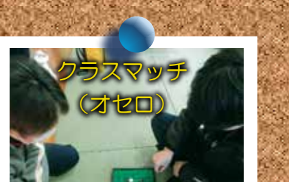
クラスマッチ （オセロ）