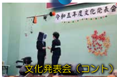
文化発表会（コント）