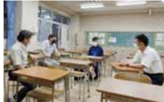
ヒューマンハート部