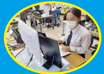
ビジネス・パソコン部