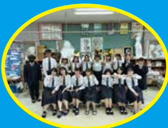
美術・イラスト同好会