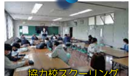
協力校スクーリング