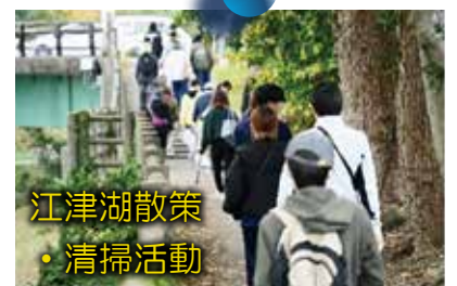
江津湖散策 ・清掃活動