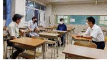
ヒューマンハート部