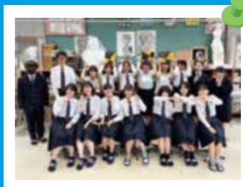
美術・イラスト同好会