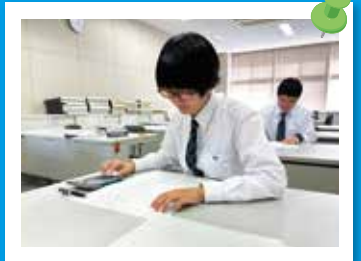
ビジネス・パソコン部