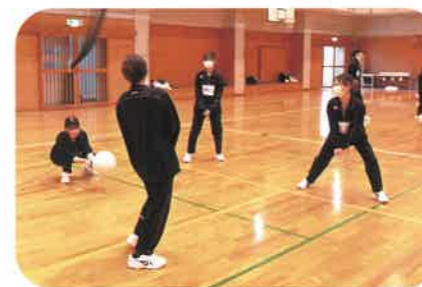
クラスマッチ (バレー)