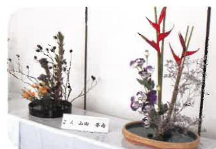
文化発表会 (生花クラブ展)