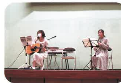
文化発表会 箏演奏