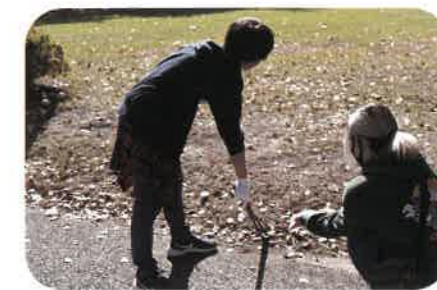
江津湖散策・清掃活動