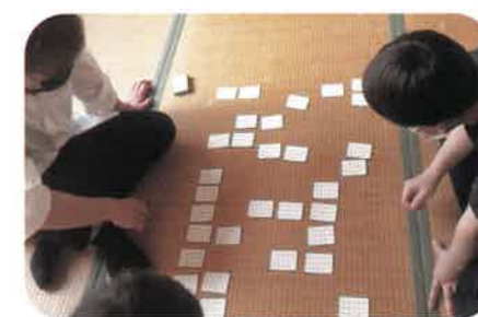
百人一首かるたクラブ