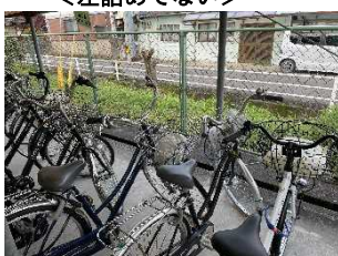
<ハンドルが右向き>