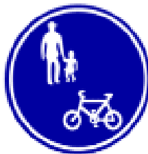
自転車及び歩行者専用