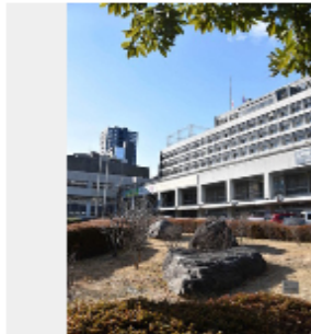
仙台市役所＝仙台市青葉区国分町3で2019年2月21日

仙台市は26日、環境局施設部の20代の一般職男性を停職6カ月▽高校の50代の女性教諭を減給10分の1(2カ月)▽中学校の20代の男性事務職員を停職6カ月――の処分にしたと発表した。