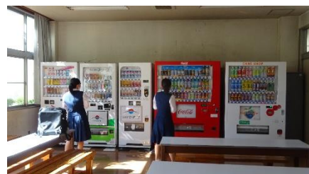
【売店の自動販売機】