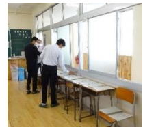
【あるクラスの配付方法】 セルフサービス形式です。