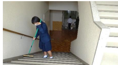
【掃除の様子】 階段も掃除しました。 ごみ捨てに行っている生徒も見えます。