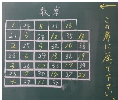
【あるクラスの座席表】 ランダムのように、規則性があります。