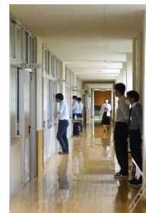
【教科担当の先生は、廊下で順番待ち】