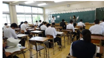
【教科担当者による学習指導】 担任の先生以外のお話は久しぶりです。