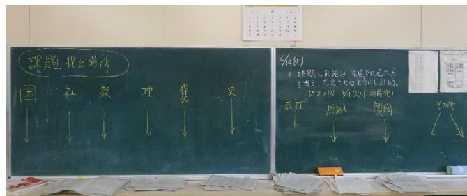
あるクラスの後ろの黒板です。提出先がわかりやすいですね！