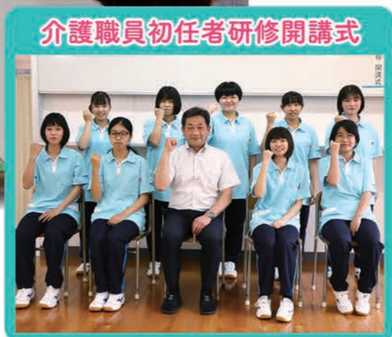
介護職員初任者研修開講式