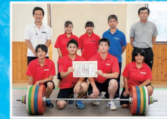
ウエイトリフティング部