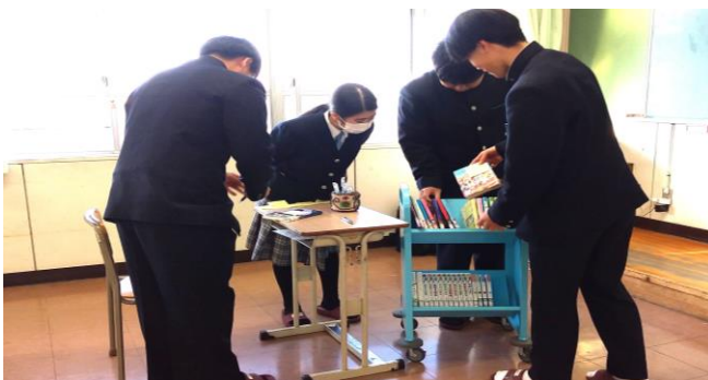
【図書委員による出前図書館】

朝の10分間読書、「たかが10分、されど10分」、「継続は力なり」です。朝の10分間が楽しいな時間となりますように。