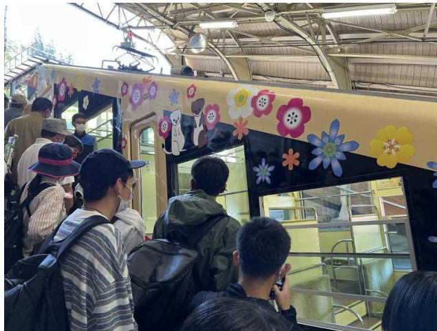
アルペンルートの出発点である立山駅からケーブルカーに初めて乗車しました