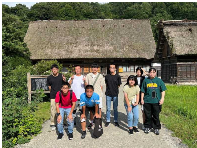
白川郷「和田家」の前で