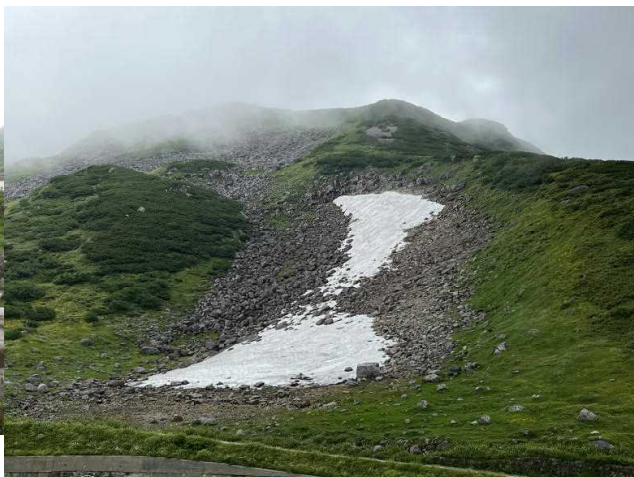
アルペンルートの最高地点室堂（2450m）は真夏でも涼しかった