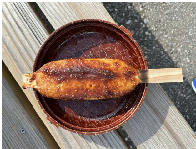
五平餅をいただきました