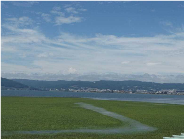
諏訪湖は水草が異常発生