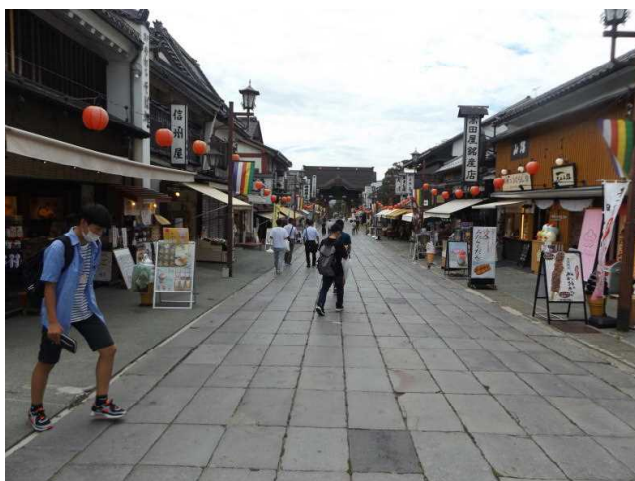
善光寺の仲見世です