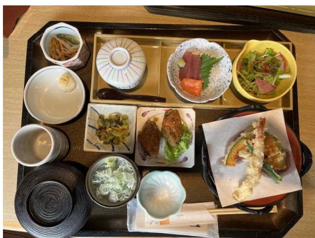
名古屋市内での豪華な昼食