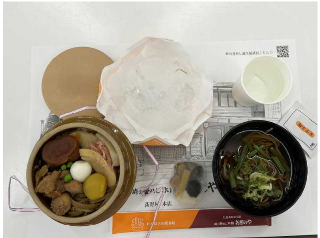
移動の途中で有名な「峠の釜めし」 をいただきました