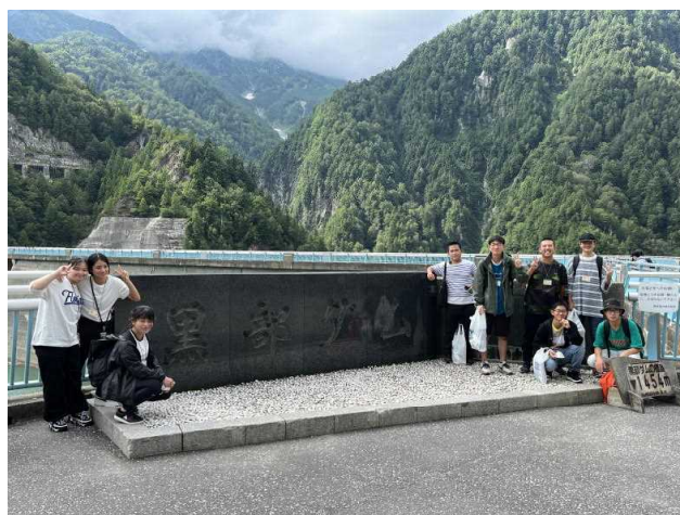
黒部ダムスケールの大きさに圧倒されました