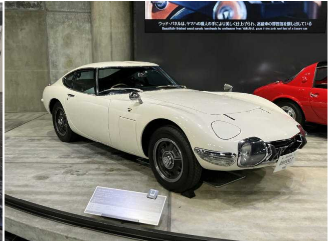
トヨタ博物館では名車がずらりと並んでいました