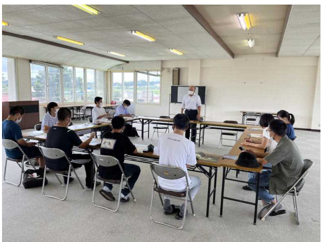
J A 長野八ヶ岳本所にて高地野菜についてお話を聞き、J A 直営の売店で人気ソフトクリームをご馳走になりました