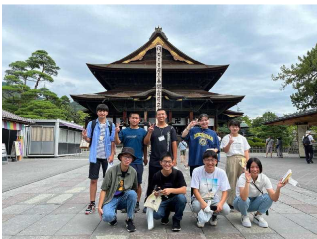
善光寺にお参りに行きました