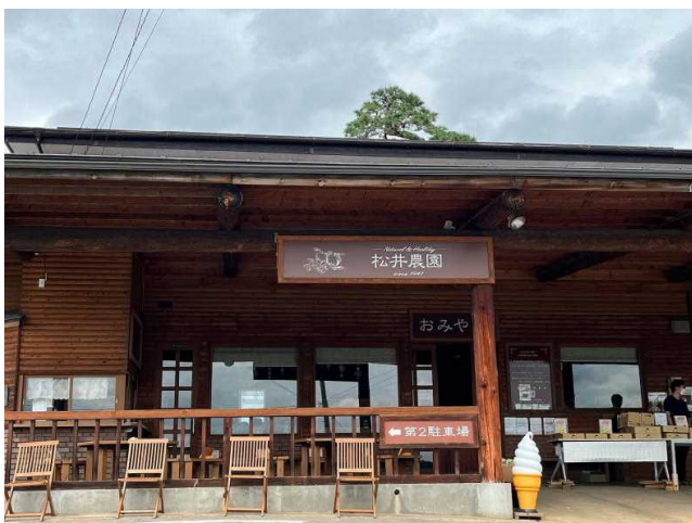
松井農園でりんごやブドウの作付状況などを聞いて後に、バーベキューを楽しみました