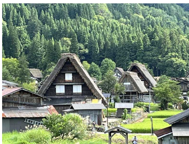
世界遺産の白川郷