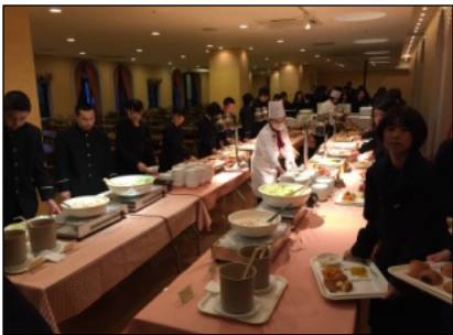
朝食バイキング (バーム&ファウンテンテラスホテル)