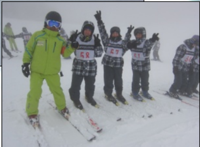
黄色のウェアは指導員さん