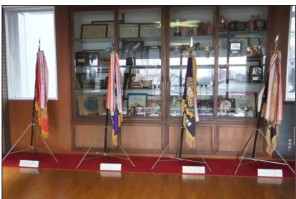
玄関、事務室前の優勝旗。