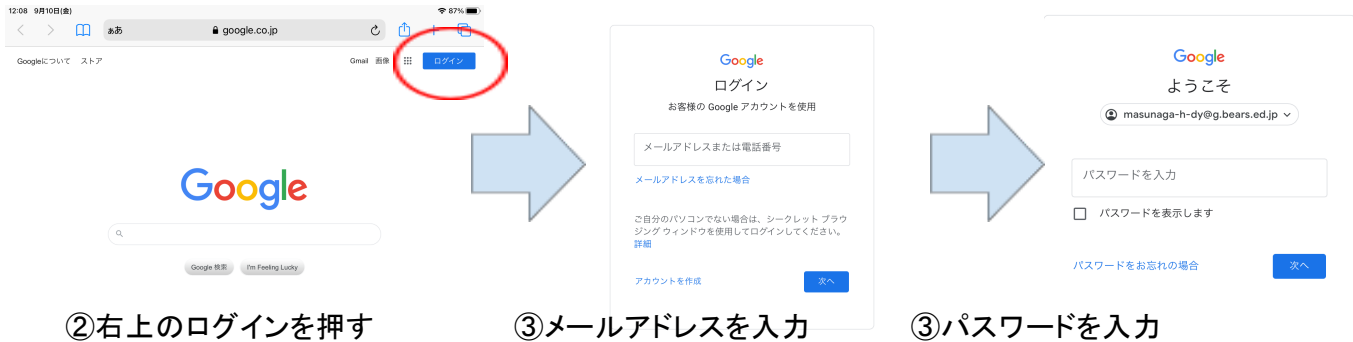
② 右上のログインを押す

③ 学校から配付された「メールアドレス」と「パスワード」を手順に沿って入力してください。パスワードまで入力が完了すると、Googleのページに戻ります。