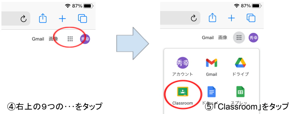
④ 右上の9つの…をタップ