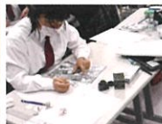
高森高校マンガ学科 オリジナル作品展示