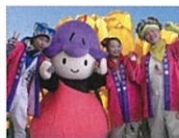
ココロ隊 オンステージ