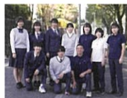
選べる自由! 中高生制服コレクション

熊本県では、一人一人を大切に作る熊本づくりをめざし、人権に関するさまざまな広報啓発活動を行っています。その一環として、県民の皆さまに人権を身近に感じていただくため、人権フェスティバルを開催します。