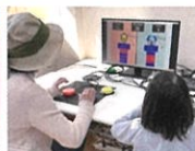
UDe-スポーツ 体験コーナー