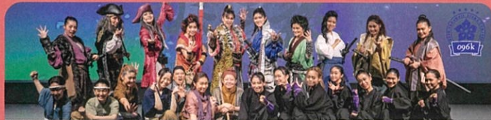
熊本県人権月間イメージキャラクター 096k熊本歌劇団