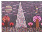
アールブリュット 作品展示