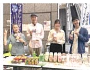
フェアトレードシティ くまもとマルシェ