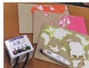
熊本大学盲学校用教材開発 サークル「Soleil(ソレイユ)」