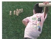
モルックに チャレンジ!