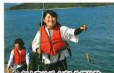
無人島サバイバル生活体験

【主な行事や活動】 学力推移調査 研究論文作成 職業講話 無人島サバイバル生活体験