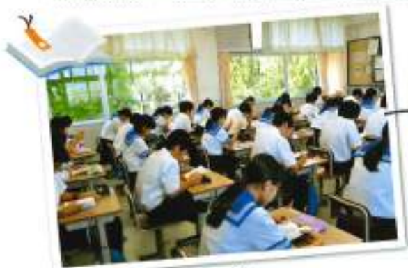
朝読書・リスニング