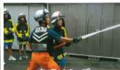
インターンシップ