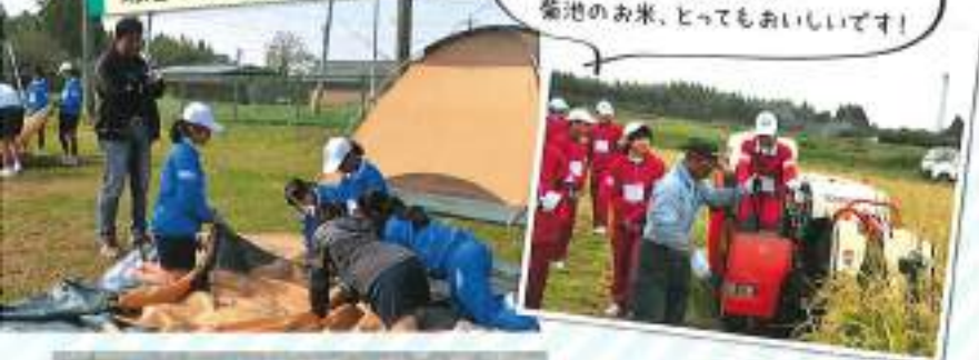
菊池のんびり農村生活体験

初めてのテントでの宿泊と、 火起こし・料理を体験！ 菊池のお米、とってもおいしいです！