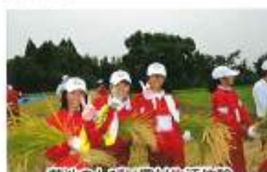
菊池のんびり農村生活体験