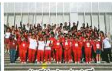
イングリッシュキャンプ