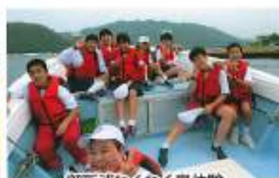
御所浦わくわく島体験