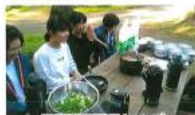
阿蘇自己発見キャンプ