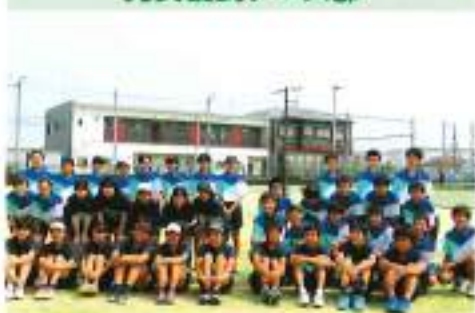
男女硬式テニス部