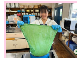
「服飾手芸」の藍染実習