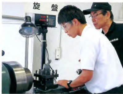
サイエンスキャンプ1