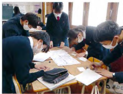
総合的な探究の時間