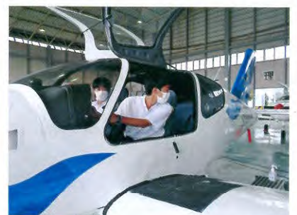
サイエンスキャンプ2