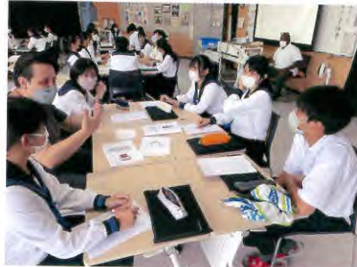
グローバルコミュニケーション(対面)