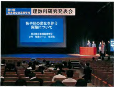
理数科研究発表会