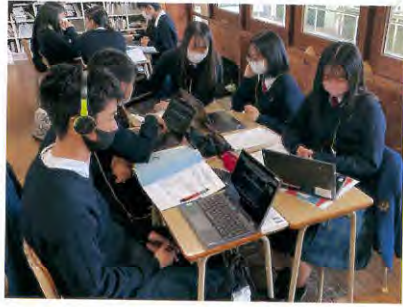
グローバルコミュニケーション研修