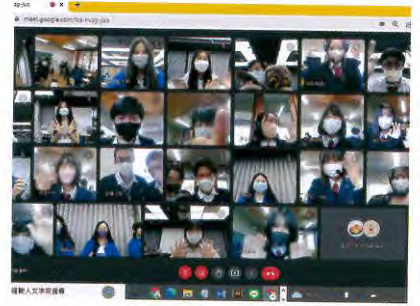
タチチラ高校との交流