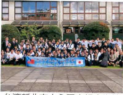
台湾新北市立永平高級中学校との交流