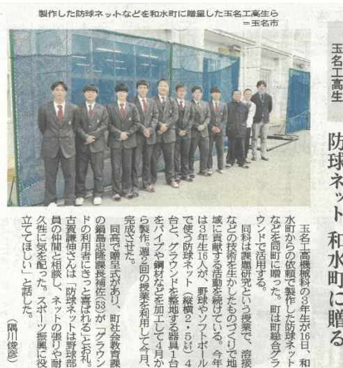
玉名工高生 防球ネット 和水町に贈る