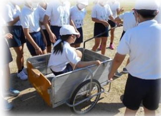
睦合小学校への リヤカー修理