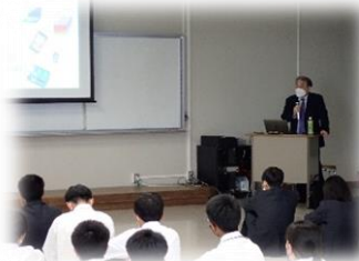
東海大学教授 による講演