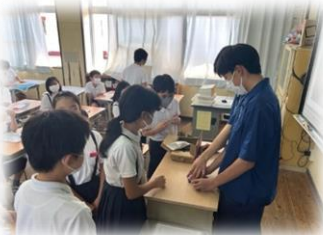
築山小学校への ものづくり教室