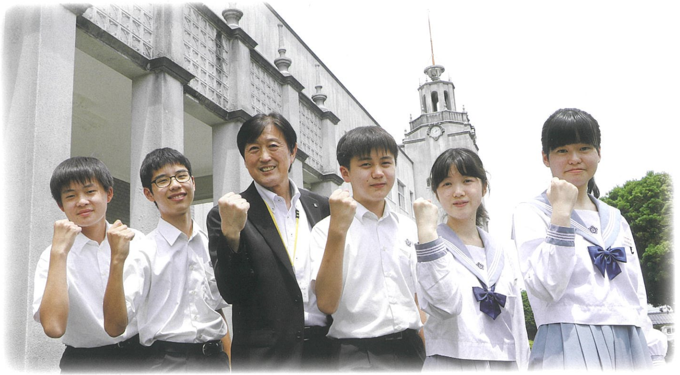
西澤校長と生徒会執行部