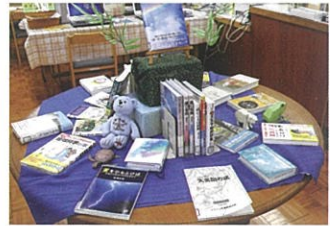
県下でも有数の蔵書数を誇る図書館。その数なんと8万9千冊!