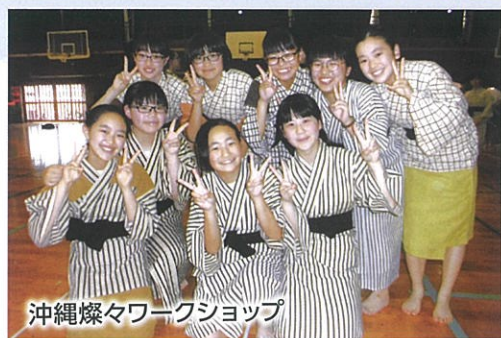
沖縄燦々ワークショップ