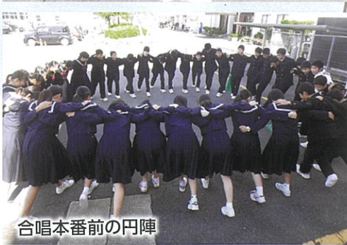
合唱本番前の円陣