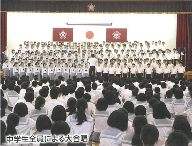
中学生全員による大合唱