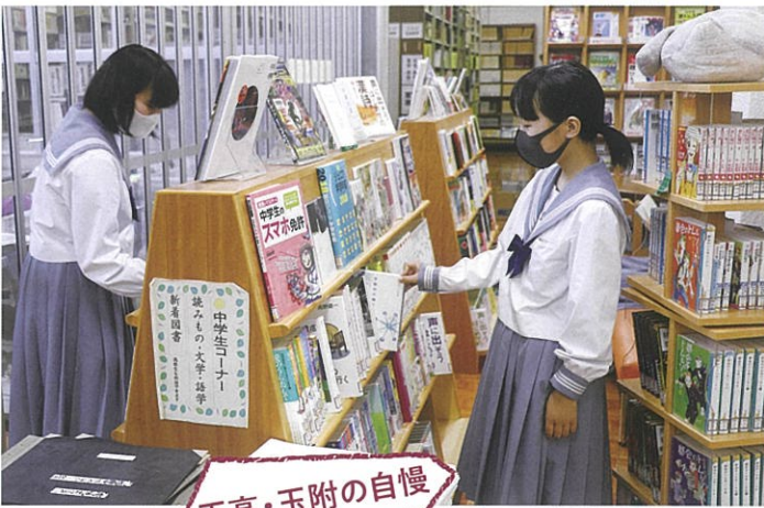
玉高・玉附の自慢