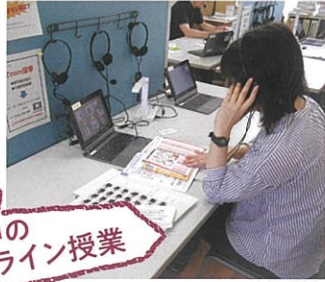
休校中の オンライン授業