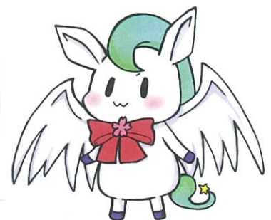
玉名高校・玉名高校附属中学校 キャラクター わかごまる

百人一首部と放送部は 今年度から活動を 始めました。 玉高生と一緒に 頑張っています!