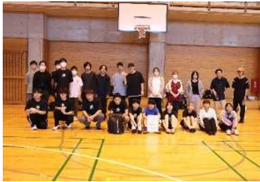
定時制・通信制高校総体