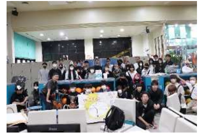
スポーツ交流会 （ボーリング大会）