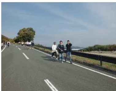
小岱山一周大会（競歩会）