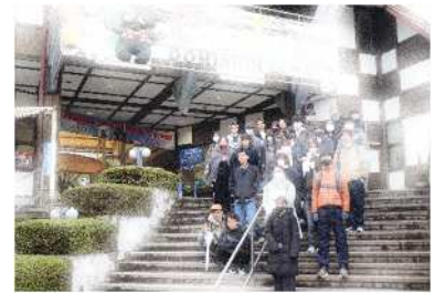
研修バスハイク （カドリードミニオン）