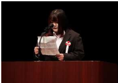
定時制・通信制文化大会 （生活体験発表）