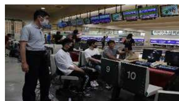
スポーツ交流会 (ボーリング大会)