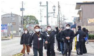
小岱山一周大会(競歩会)