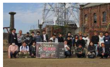
研修バスハイク (三池炭鉱万田坑)