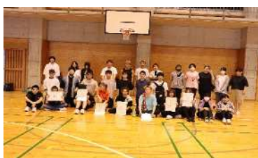
定時制・通信制総体 (バドミントン)