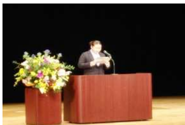
定時制・通信制文化大会 (生活体験発表)