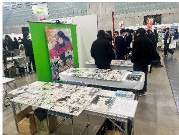
マンガ学科作品展示。たくさんの方が鑑賞していました。マンガ大人気です!

12月23日(土) KSH に参加した生徒のみなさんお疲れ様でした!大変良い経験になったと思います。当日はたくさんの方に高森高校ブースを見て頂き、大好評でした。今回の経験を今後の探究活動に活かしていきましょう!