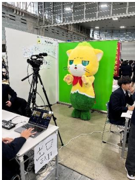
産業局のグリーンバックであそさんと合成しての記念撮影。あそにゃんがあそにゃんに合成?