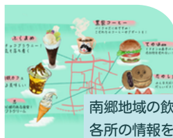
南郷地域の飲食店や 各所の情報を発信

振興局では、町の振興を目的に、特産品のPRやマンガ・イラストを活用した地域貢献に取り組んでいます！