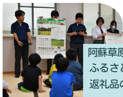
阿蘇草原のPR ふるさと納税 返礼品の提案

本校では、架空の役場である「南郷谷役場高森支所」を設定し5局（観光、振興、総務、産業、メタバース）に分かれ、関係機関と協働しながら探究活動を行っています。各局は「探究のサイクル」（①課題の設定→②情報収集→③整理・分析→④まとめ・表現）を繰り返すプロセスを通して、地域の課題解決に取り組むとともに、論理的思考力や判断力、コミュニケーション能力、表現力等の伸長を目指しています。