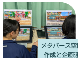
メタバース空間の 作成と企画運営

産業局では、高森町の魅力発信を目的に、CMやサイトの作成、イベント企画やSNSの活用、VR動画作成などを実践中です！