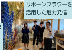
リボンフラワーを 活用した魅力発信

観光局では、ふるさと納税返礼品の提案や南郷地域の観光PRを中心に、関係機関と連携して活動を展開しています！