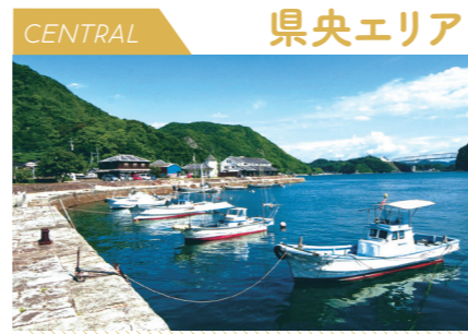
CENTRAL 県央エリア 日本が誇る歴史的建造物が 多く点在する

阿蘇エリアは熊本県の東部、大分県・宮崎県との県境近くに位置しています。阿蘇エリアのシンボルは何と言っても、世界最大級の大きさを誇るカルデラを有する活火山・阿蘇山。圧倒的なスケールの景観は必見です。