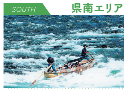
SOUTH 県南エリア 自然や文化を満喫できる観光地が満載

日本最南端の政令指定都市である熊本市。加藤清正が築いた「熊本城」が市のシンボル。城下町を中心に広がる繁華街は活気にあふれ多くの人で賑わっています。名物グルメも数多くあり、食も存分に満喫できます。