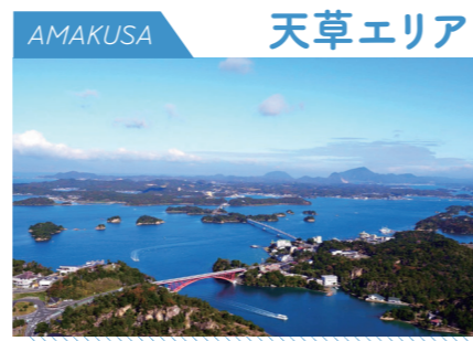
AMAKUSA 天草エリア 異国情緒に包まれたリゾート地

鹿児島県との県境にあり、八代海に面した八代地域・芦北地域、球磨川流域に広がる球磨地域で構成されています。日本三大急流の一つである球磨川は、川下りやラフティングなどを楽しめるスポットとしても人気です。