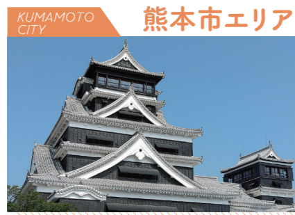
KUMAMOTO CITY 熊本市エリア 熊本城を中心に 歴史と最先端が融合する

熊本市に隣接する宇城・上益城地域からなる県央エリア。世界遺産である三角西港や日本最大級の石造アーチ橋の通潤橋など、歴史的建造物が点在します。また、阿蘇くまもと空港をはじめとした交通の拠点としても発展しています。