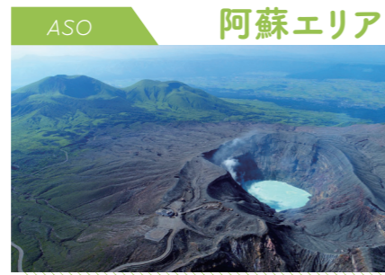
ASO 阿蘇エリア すべての観光要素を網羅した 五感を刺激する

西は有明海に面し、東はなだらかな山々が連なる県北エリア。自然の壮さを感じられるスポットがアクセスしやすい場所にあり、観光資源の一つとなっています。温泉地も点在し、リフレッシュに多くの人々が訪れています。