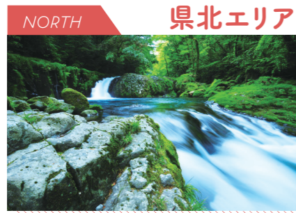
NORTH 県北エリア 歴史・伝統に触れるスポットがたくさん

西は有明海に面し、東はなだらかな山々が連なる県北エリア。自然の壮さを感じられるスポットがアクセスしやすい場所にあり、観光資源の一つとなっています。温泉地も点在し、リフレッシュに多くの人々が訪れています。