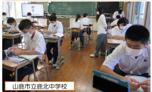
山鹿市立鹿北中学校

全体で文法の確認をした後、生徒の希望によって、基礎コースと発展コースに分かれます。基礎コースは先生のアドバイスを受けながら問題を解き、発展コースはタブレットのガイドを聞きながら問題を解いています。（3年 英語）