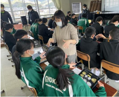
玉東町立玉東中学校（音楽科の実践）

今後も子供たちの学びの充実につながるICT活用を目指し、子供たちや先生たち、学校を応援していきます。