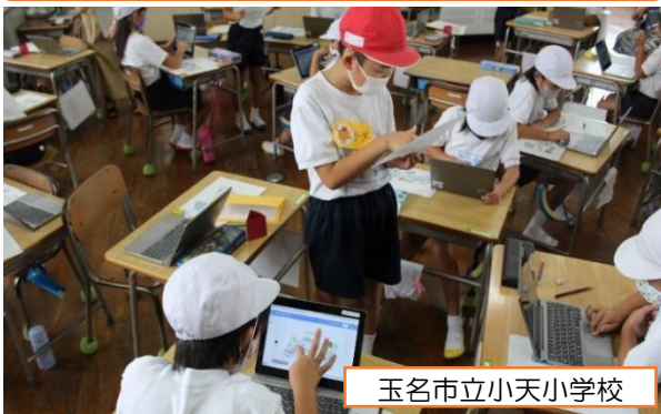
玉名市立小天小学校

単元のゴールを「1年生に、見学旅行で一緒に行く動物園の道案内をする」とすることで、子供たちの興味・関心を高めています。タブレットの利点を活かし、どのように道案内をするか色々な道順を試すなど、子供たちが主体的に学んでいます。（2年 国語）