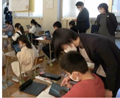
南関町立南関第二小学校（算数科の実践）