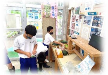
【高森町立高森東学園義務教育学校】