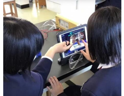
芦北町立田浦中学校（理科の実践）