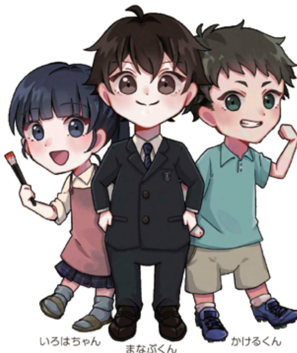
岱志高校イメージキャラクター