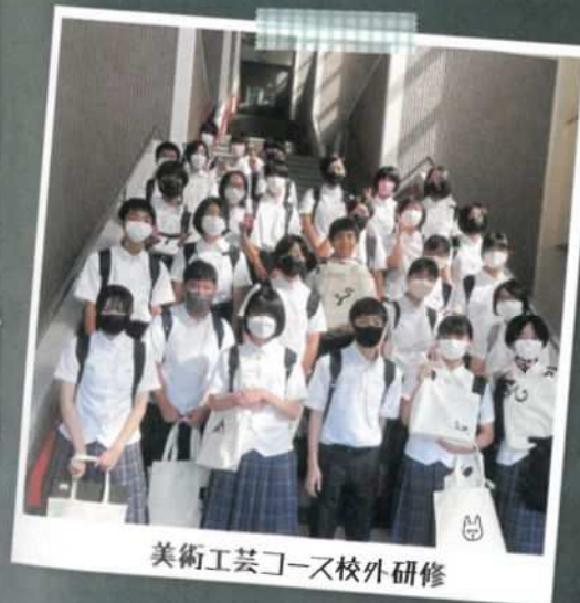
美術工芸コース校外研修