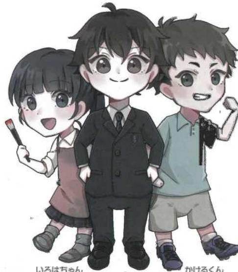
いろはちゃん まなぶくん かけるくん