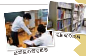
放課後の個別指導