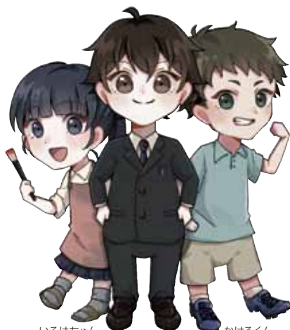
いろはちゃん まなぶくん かけるくん