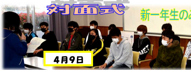
対面式 新一年生のみなさん