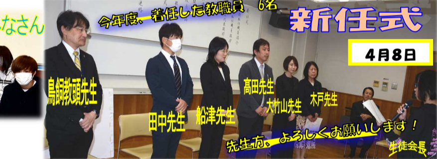
新任式 今年度、着任した教職員 6名