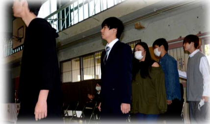
緊張した面持ちで入場する新入生！