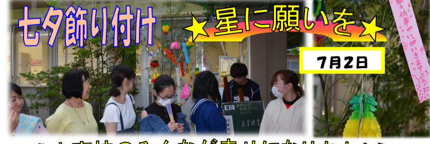
七夕飾り付け ★星に願いを★

「第1回岱定らしんばん」を行いました。「岱定らしんばん」とは本校定時制独自の進路行事です。4月に実施した岱定独自の学力テスト「BIG GATE」の学力分析報告から、今後の学校生活にどう生かしていくかという視点で、生徒各自に考えてもらいました。その中で、学年の平均点や得点の経年変化などが示されました。さらに「どんな生徒が伸びていくか」という観点から、先生方が動画の中で生徒たちにそのポイントを伝えました。生徒たちは自分やクラス、他学年の特徴などを知ることで、学習への意欲を新たにしていました。