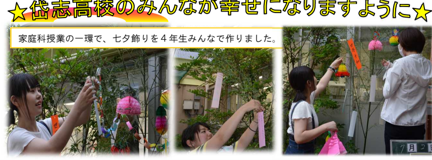
★岱志高校のみんなが幸せになりますように★ 家庭科授業の一環で、七夕飾りを4年生みんなで作りました。