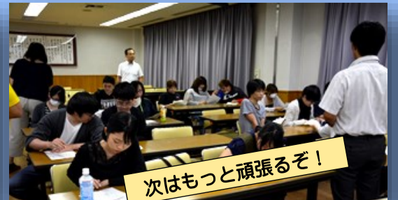
次はもっと頑張るぞ!