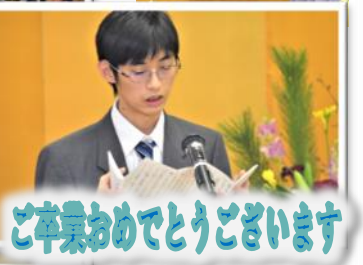
ご卒業おめでとうございます