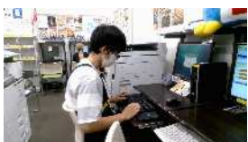
小売店 バックヤード