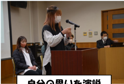
自分の思いを演説

1月13日(金)に生徒会選挙が行われ、会長1名、副会長5名が選ばれました。20日(金)に信任された生徒会役員の認証式・交代式が行われました。旧生徒会のみなさんお疲れさまでした。新生徒会の活動でよりよい学校になるよう期待します。