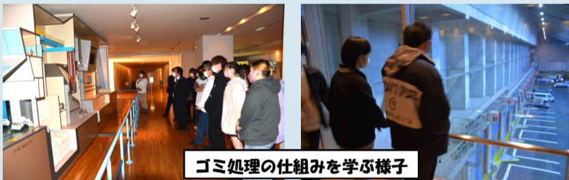
ゴミ処理の仕組みを学ぶ様子

11月25日(金)に福岡市にて研修を行いました。まず「臨海3Rステーション」では、ごみの処分方法や資源のリサイクルについて学びました。次に向かった「マリンワールド海の中道」では、水と共に生きる動物の観察などを通して、自然を大切にする心を学びました。また、1日でみんなの親睦も深まったように感じられました。