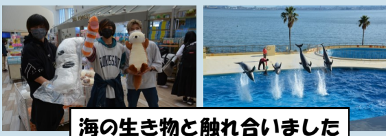
海の生き物と触れ合いました