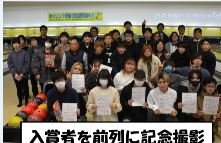
入賞者を前列に記念撮影