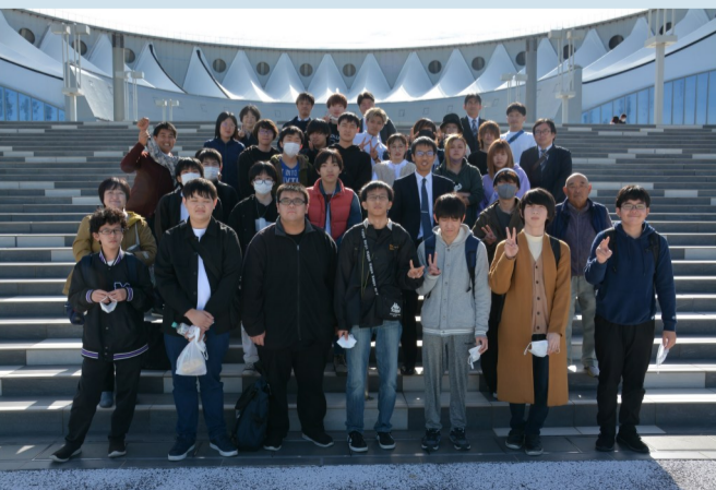
充実した1日となりました!