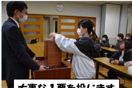
大事な1票を投じます