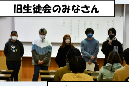
旧生徒会のみなさん