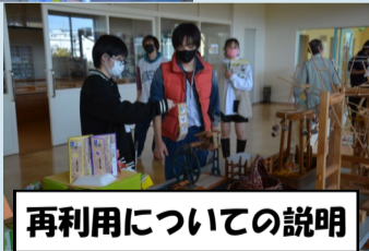
再利用についての説明