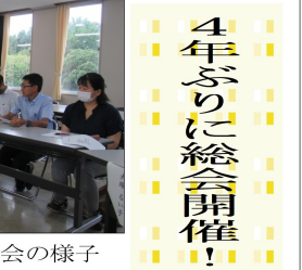
△令和5年度同窓会総会の様子

4年ぶりに総会開催! 同窓会から助成金授与 羽ばたけ!翔陽生! 令和5年7月13日(水)に、育友会・同窓会の合同で助成金授与式が行われ、全国大会へ出場する部活動や団体及び海外研修に参加する生徒へ激励金が授与されました。各部活動の代表者や各個人参加生徒達に校長先生はじめ会長達から激励の言葉が贈られました。そして、生徒達からは大会や研修に臨む力強い決意が述べられました。