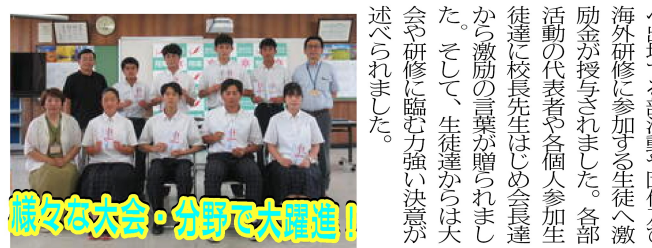
様々な大会・分野で大活躍!

これまで新型コロナウイルス感染拡大防止の観点より、諸活動が中止や制限され思うように活動できませんでした。4年ぶりに総会が開催されました。 遠方より同窓生が参加したりとまた少しづつ以前の活動を取り戻しつつあります。令和7年には創立百二十年を迎えるので、今後同窓会から母校を応援できるような努めて参ります。