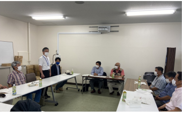
昨年7月役員会開催にあたり、校長先生よりご挨拶いただきました。

現在、グローバル人材の育成として、国際交流プログラムを計画しています。語学力やコミュニケーション力を高め、異文化を理解し受け入れ、外国人と共生・協働する資質を育成します。翔陽高校で実践的・体験的な学習活動を通して基礎をしっかりと学び、多様性を認め合う力を身につけた翔陽生は大きな魅力となるでしょう。今後も学校の魅力を高め、今まで以上に生徒が活躍し、生徒の夢を実現できる翔陽高校を目指し取り組んで参ります。