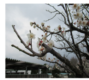
△校庭に咲く梅の花