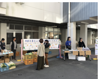
令和元年度 翔陽祭の様子

私が同窓会幹事長になって、早くも四年が過ぎようとしています。先輩や後輩たちと色々な議論をし、学校行事に参加し楽しんでいきます。