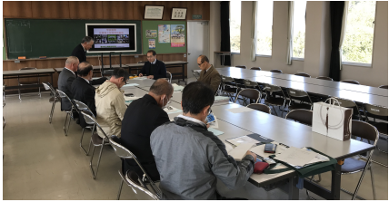
佐賀県立神崎清明高校同窓会と情報交換しました。

翔陽高校として二四年目となりました。総合学科からできる幅の広い教育活動をを通して、グローバルな視点と能力を身につけた、地域に貢献できる人材を育成することを教育目標に掲げています。「自ら気づき、考え、行動する」という教育スローガンの基、生徒の主体性を伸ばす教育に重点を置き、キャリア教育を推進しながら、望ましい職業観・勤労観を育て、生徒の夢実現に向けた教育に取り組んでいます。二〇二〇年度熊本県公立高校入試では、本校の志願倍率は、前期選抜二・三六倍、後期選抜一・二四倍でした。後期選抜については、熊本市以外で定員を満たした高校は、本校を含む四校のみという厳しい状況でした。生徒の活躍や日頃の様子が評価された結果ではあります。本同窓会会則第十三条によります、年会費(二千元)の納入への御協力をお願い致します。