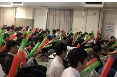
バルーン両手に応援です！！