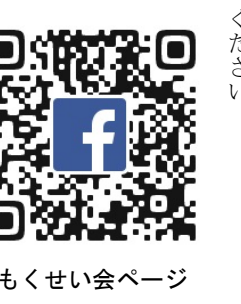
もくせい会ページ

第47回熊本県高校総体 様々な部活動で輝かしい成果 今年も本校生徒が熊本県高校総体において輝かしい成績を残してくれました。 県内各地で開催された第四七回熊本県高等学校総合体育大会において、男女併せて十七の部活動が出場しました。 拳法部は男子団体三連覇、女子団体初優勝を成し遂げる事ができ、男女とも個人・団体両方で全国高等学校日本拳法選手権大会に出場しました。 フェンシング部では男子団体が二年ぶり十三回 目の優勝、女子団体が二年連続十回目の優勝をし、個人戦では男女併せて五種目五名の生徒が南部九州で開催されたインターハイに出場しました。 馬術部では残念ながら個人競技での出場は叶いませんでしたが、団体として、全日本高等学校馬術競技大会に出場することができました。 惜しくも上位には入賞できませんでしたが、多くの生徒たちが精一杯頑張っていました！