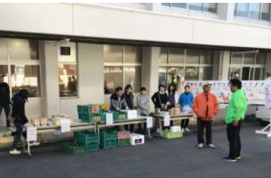
若手会員が手伝ってくれました！

当日は、野菜(さつまいも等)や米、饅頭などの販売やもくせい新聞の配布などを行い、大盛況の中、完売することが出来ました。また、前日の準備や、当日の販売などは若手の同窓会会員にも手伝ってもらい、会員同士での交流も図ることが出来ました。