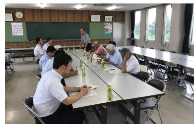
今年度、同窓会総会の様子