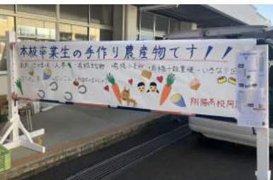
看板は自分たちで製作しました！

※各支部の活動も支援しています。各支部にて総会などの活動を行われる際は、本校事務局にご連絡ください。