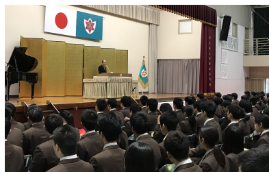
昨年度、同窓会入会式の様子