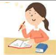
学習時間学年平均(分)