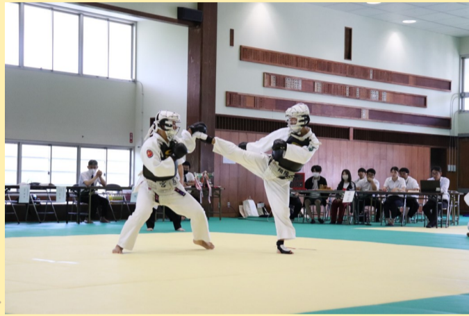
拳法部 男女団体・個人優勝