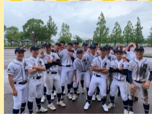
第一回戦 対小国高校 第二回戦 対八代高校

三年次にとっては最後の試合である夏の大会が行われました。二回戦で八代高校に敗れてしまいましたが、思い出に残る試合になりました。選手たちも全力で試合することができたと思います。