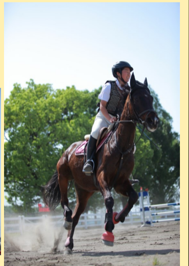
インターハイ出場