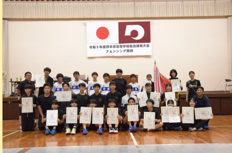
フェンシング部 インターハイ出場