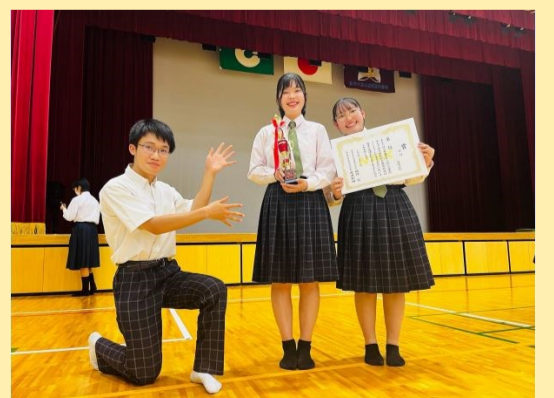
第70回 NHK杯 全国大会出場