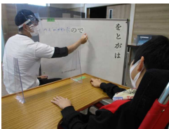
学習内容によっては、机上に透明パーテーション