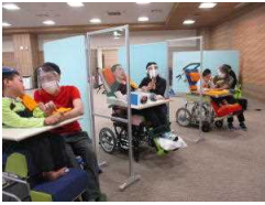
透明パーテーション

感染症予防対策のため1学期までは、十四人の通学生を4グループに分け、一人が2日に一回1時間の授業を行っていました。例年よりも早い八月二十四日に2学期が始まり、九月十四日からは、4グループから2グループになり、毎日1時間授業を行えるようになりました。十月十二日からは、毎日2時間の授業、十一月九日からは、2時間半の授業を実施できるようになりました。それでも、通常の授業時間の半分です。今後も毎日の授業時間を大切に授業の充実を図っていきます。在宅訪問教育は、保護者と相談しながら、週2回の通常授業を実施することができませんでした。体調不良で登校が難しい生徒と併せて、入所施設の居室で見ることができるよう、教師が本の読み聞かせや楽器演奏など、オリジナル動画をDVDにして提供しています。 まだ新型コロナウイルス感染症の収束が見えない状況です。そのままだ、隣にいる友達の姿が見えなかったり、画面越しに見たりしていましたが、見えるようになり、児童生徒も喜んでいきます。友達と直接関わる活動はまだできませんが、友達の様子も意識しながら、取り組めるようになりました。また、これまでの感染症対策に加え、オゾン発生装置を2台設置しました。今後も、より安全で安心な学習環境を整えていきます。