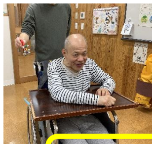
聴力検査の様子 鈴などの楽器の音を聴きました