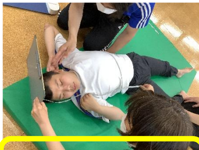
身体測定の様子 横になり測定をしました