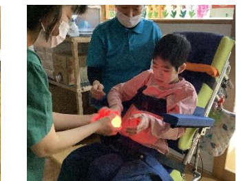
視力検査の様子 好きな教材を見つけました