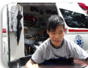
消防車・救急車の中は道具がいっぱいでびっくり!