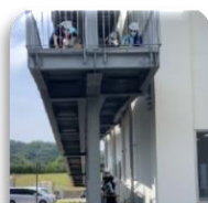
3 はまゆう療育園内の スロープを使って外へ