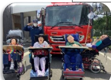
大きな消防車の前でハイポーズ!