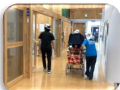
2 学校の渡り廊下から はまゆう療育園へ移動