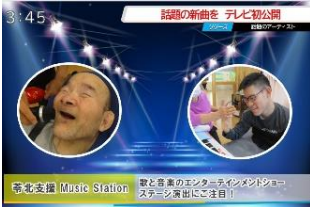
高等部「苓北支援高等部テレビ RKT」