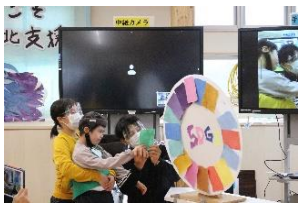
小学部「わたしたちのSDGs」