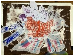
「発見!ほくたちのカラフルザウルス」 (小学部共同作品)