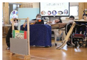
中学部「やってみよう♪」