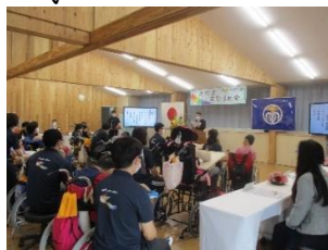
< セレモニーの様子 >

新校舎で初めて迎える新年度、コロナ第六波のため、暫く児童生徒は登校を見合わせていましたが、四月十八日(月)から授業を再開しました。ここ二年間、感染予防のため分散短縮登校としていましたので、全員が一斉に登校し、それぞれのクラスで真剣に授業に取り組んだり、集会のため全員が集まって賑やかにしたりしている様子は、活気があり、とても嬉しく感じています。 六月十三日(月)に新校舎のおひろめ会を開催しました。会は二部構成となっており、第一部では、本校校長と熊本県教育委員会の挨拶や来賓の御祝辞の後、児童生徒代表の高等部生徒が「学校で勉強できて、嬉しいです。新しい学校だから、とっても嬉しいです。」と喜びの気持ちを発表しました。第二部では、モルックやポッチャなど児童生徒が考えたゲームをお客様と一緒に楽しんで、交流を深めました。感染予防のため、規模を縮小せざるを得ませんでしたが、会に参加した全員で新校舎の完成を喜び合いました。