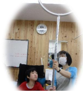
さすまたの位置を確認している様子