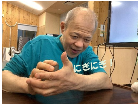
粘土を成型するぞ～!