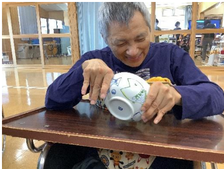
内田皿山焼の絵や感触をチェック

4日目と5日目は、ポスター作りとお礼状づくりに取り組みました。これまでの学びと生徒たちが撮った写真を使って『内田皿山焼ポスター』が完成しました。お礼状づくりでは、校外学習でお話をたくさんしてくださったことや、苓北町の器を作ってくださったことなどの感謝の気持ちを込めて作りました。