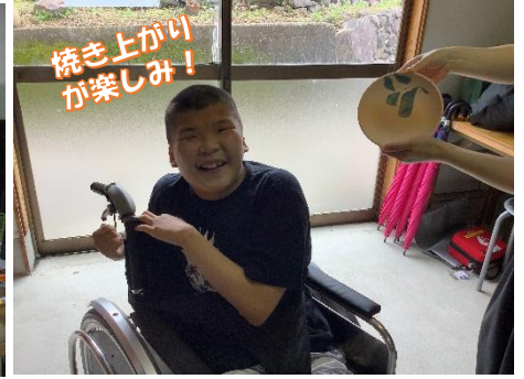
校外学習 in 内田皿山焼窯元