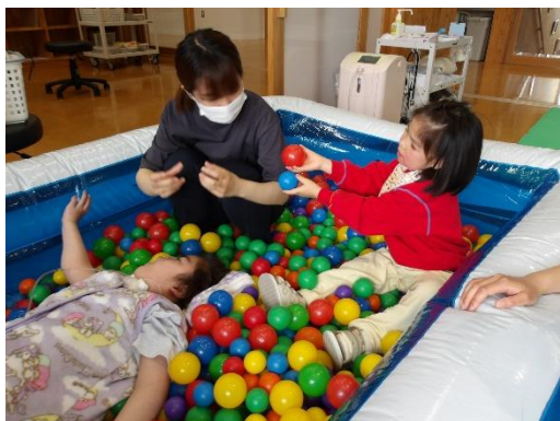
一緒に入ると楽しいね。はい、どうぞ。