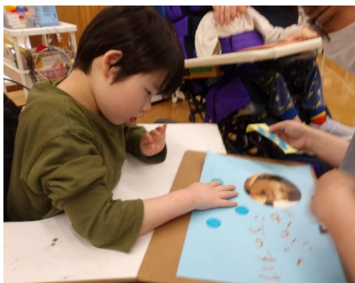
自己紹介カードをシールで飾り付け

4月14日（火）、16日（木）、17日（金）、24日（金）、27日（月）の5日間で、生活単元学習「なかよくなろう」の学習に取り組みました。その中で、自己紹介カードづくりやペアでのボッチャ大会、友達と一緒に身体を動かしたり、学校探検をしたりしました。この学習を通して、友達のことを知り、一緒に活動する楽しさを感じることができました。今年度は小学部に新入生2名が仲間入りし、全員で5名になり、さらに賑やかになりそうです。