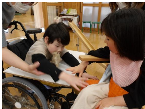
これからよろしくね！