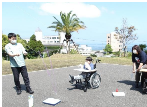
友達と一緒にシャボン玉をしたよ。