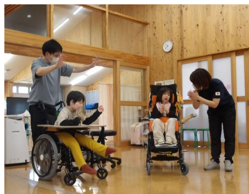
ボッチャでは友達の頑張りに拍手！